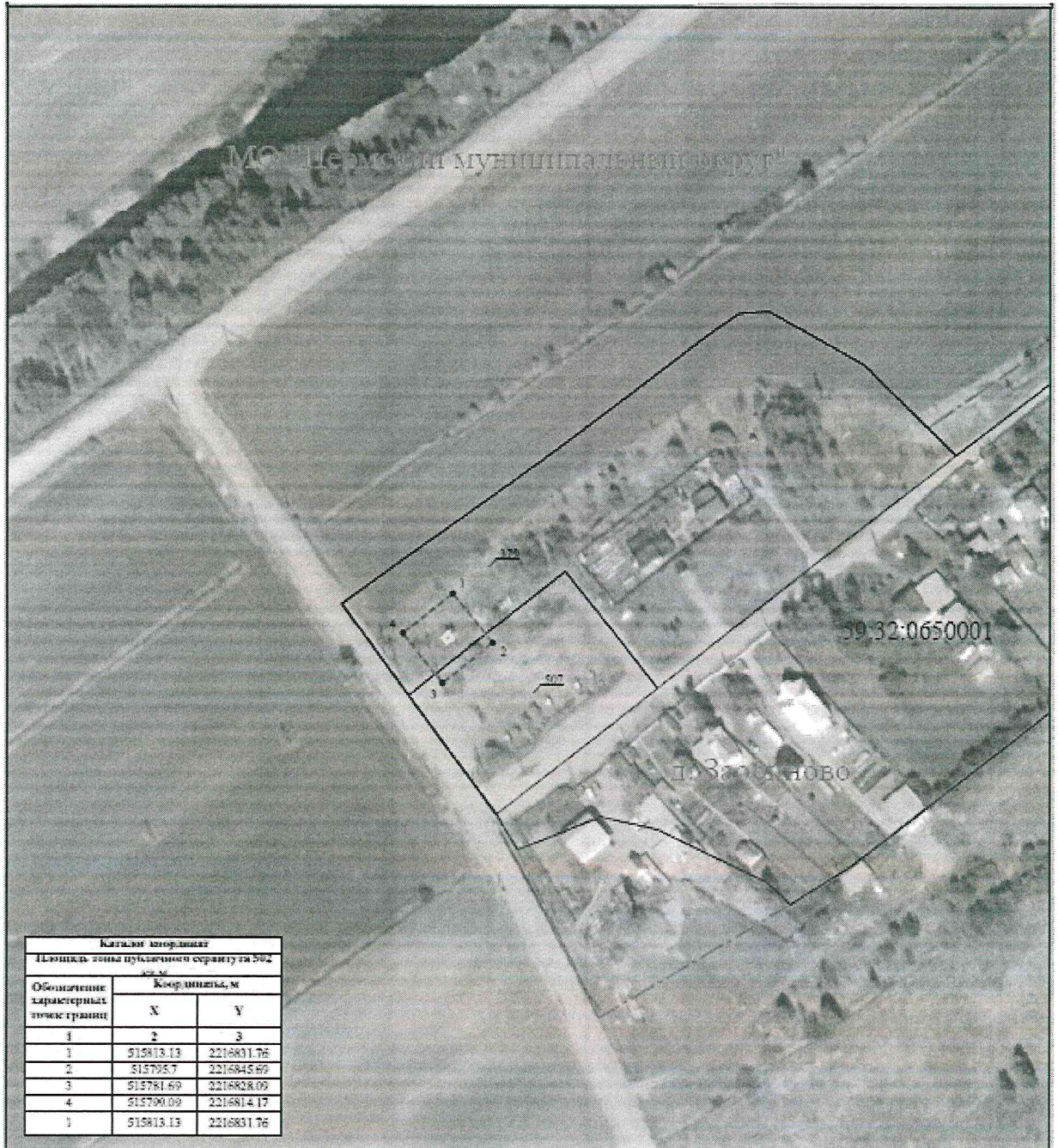
СХЕМА РАСПОЛОЖЕНИЯ ГРАНИЦ ПУБЛИЧНОГО СЕРВИТУТА Эксплуатации объекта электросетевого хозяйства ТП-43472